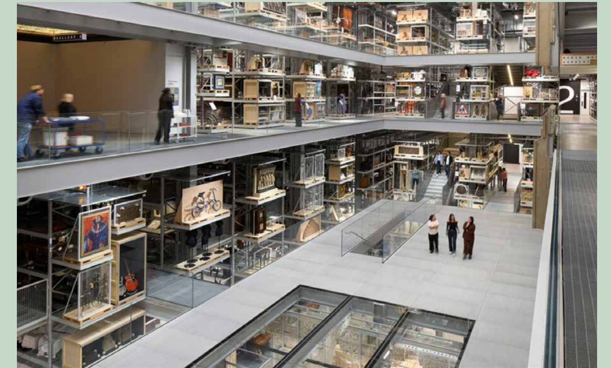
V&A East Storehouse

Gyda'r V&A East Storehouse, mae'r V&A wedi cymryd cam i ffwrdd o storffeydd gweladwy, wedi'u rheoli'n ofalus, i storffeydd y caniateir mynediad iddynt gan greu profiad hunan-dywys gwirioneddol, a rhoi cip ar sefyllfa gefn tŷ yr amgueddfa. Mae mynediad am ddim unrhyw ddiwrnod o'r flwyddyn heb angen trefnu ymlaen llaw.