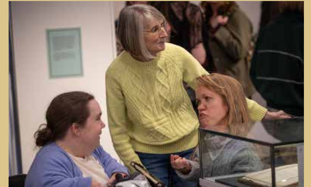
Showtown Blackpool Marvels and Mahem

Roedd yn hanfodol cysylltu â chymuned y syrcas fel y gellid datgloi potensial y casgliad. Er mwyn dechrau meithrin ymddiriedaeth gyda'r gymuned hon, gwahoddodd yr amgueddfa berfformwyr lleol oedd wedi ymddeol i ffurfio rhwydwaith ar gyfer cymuned y syrcas. Yna, roedd modd iddynt gynnal digwyddiadau a gweithdai lle gallai cymuned y syrcas recordio storïau a chyflwyno sgysiau yn rhannu eu gwybodaeth. Bu gwirfoddolwyr casgliadau yng Nghanolfan Hanes Showtown yn gwneud gwaith dogfennu sylfaenol i wneud y casgliad yn hygyrch i rwydwaith cymuned y syrcas ac wedyn roedd y rheiny'n gallu cefnogi gwaith ymchwil, dynodi benthyciadau, casglu, a chreu straeon a blogiau digidol.