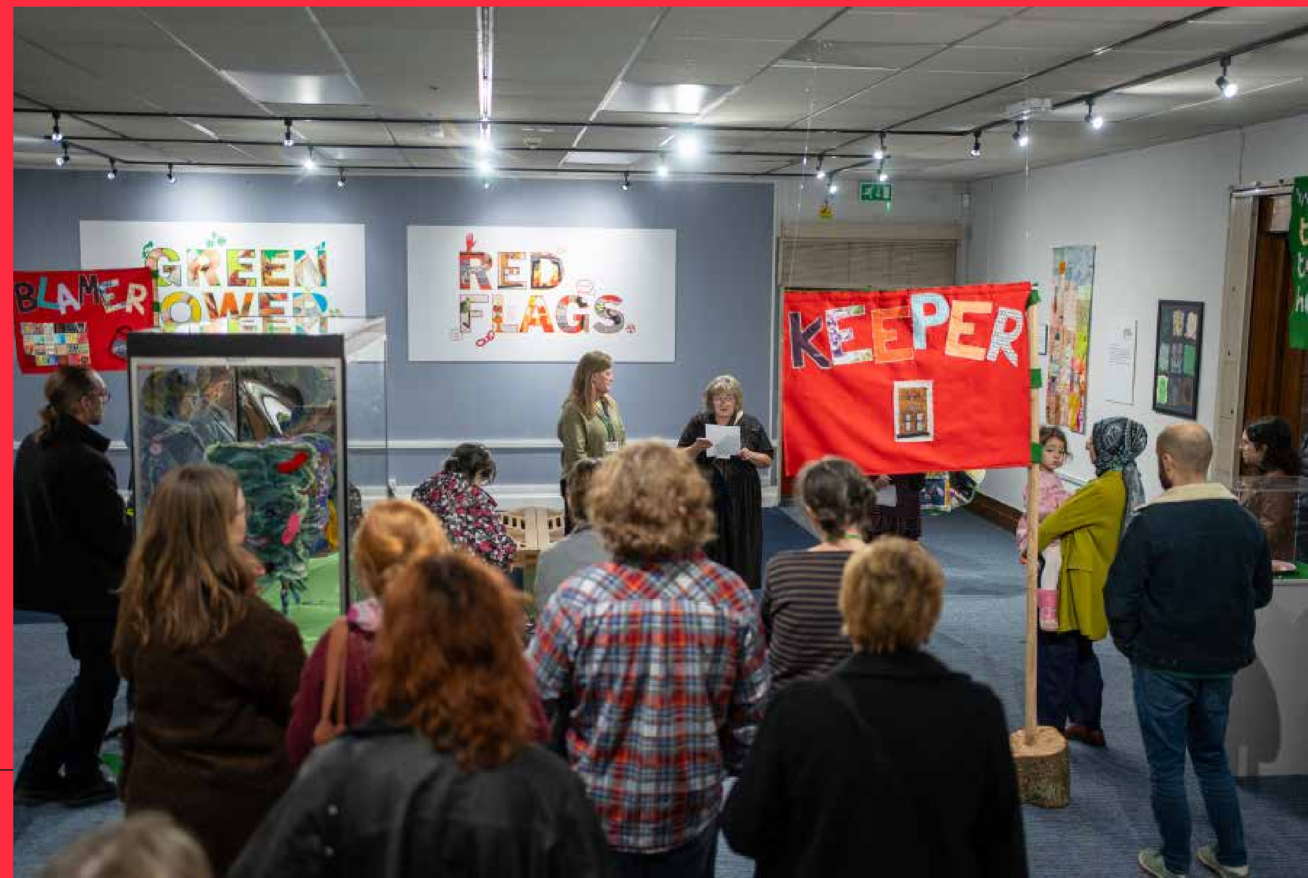
Green Power.