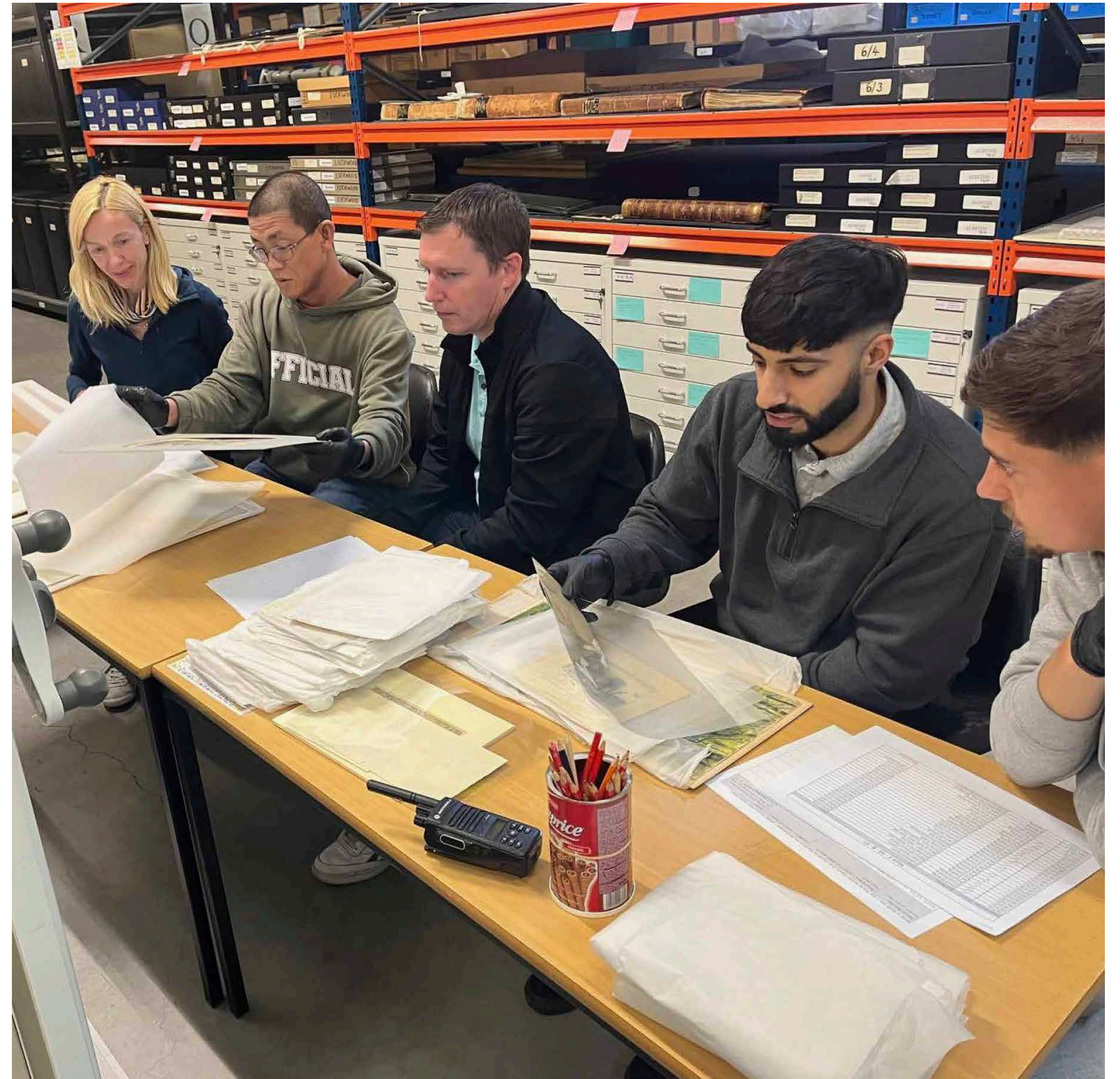
Ymddiriedolaeth Amgueddfeydd Birmingham