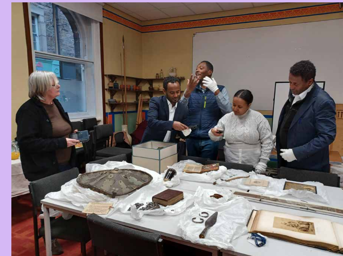
Kings Own Royal Regiment Museum