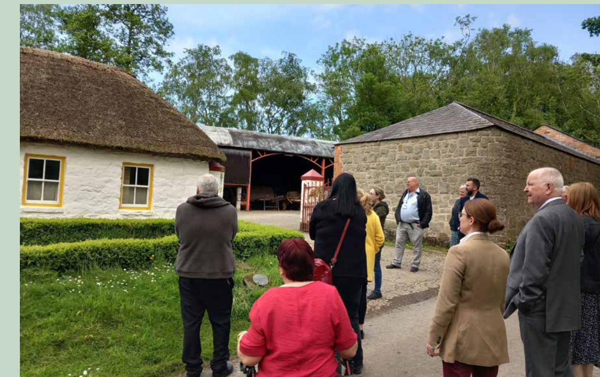
Conflict and Legacy Interpretive Network

Fel rhan o'r prosiect, lanswyd arddangosfa ddigidol ledled y rhwydwaith, gyda lluniau o arteffactau a recordiadau clyweledol o aelodau'r rhwydwaith yn cyflwyno arteffactau o'u casgliadau i gyfleu eu naratif personol o hanes a gwaddol 'y Trafferthion'.