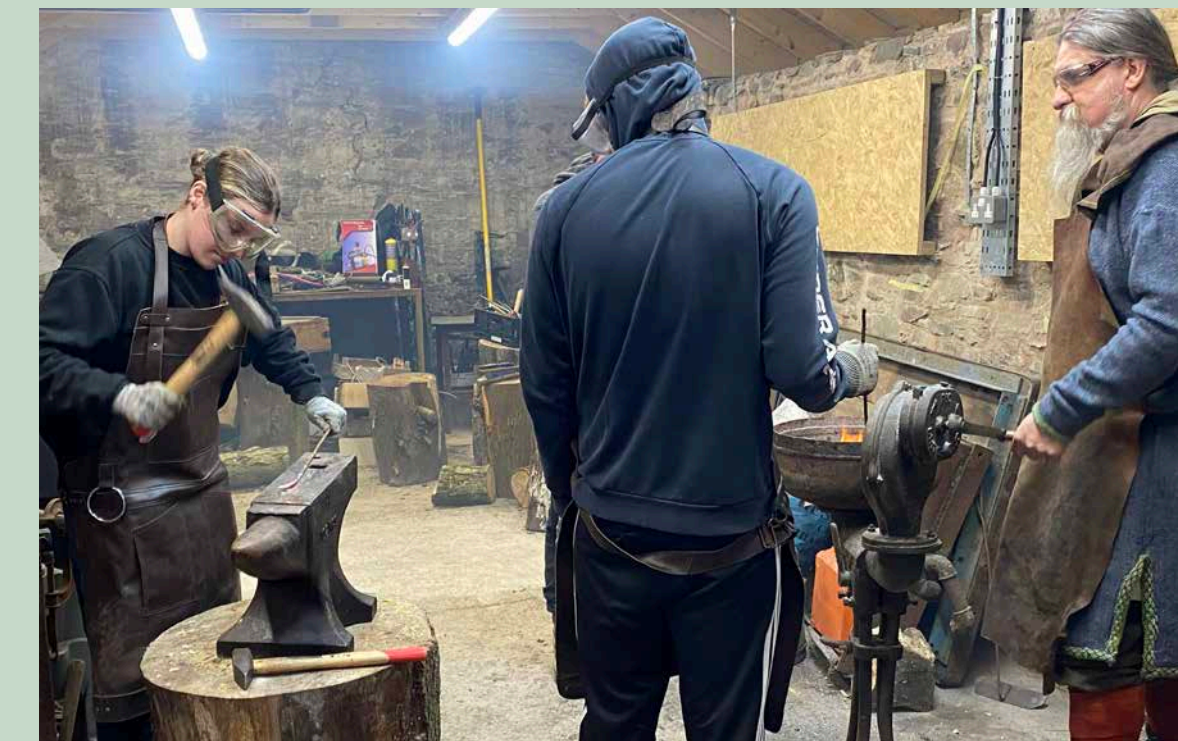
Amgueddfa Whithorn a Building Futures Galloway

Mae'r gwaith yn adeiladu ar brosiect blaenorol, Whithorn Rebuild, a fu'n gweithio gyda phobl ifanc agored i niwed a disgyblion oedd yn peidio â mynychu'r ysgol uwchradd leol, i'w galluogi i roi cynnig ar gyfleoedd ym maes sgiliau adeiladu hanesyddol, sy'n brin ledled Prydain. Sefydlwyd Whithorn Rebuild fel Building Futures Galloway, menter gymdeithasol ar wahân, sydd bellach yn cynnig sgiliau adeiladu mwy amrywiol i'w phrentisiaid ifanc.