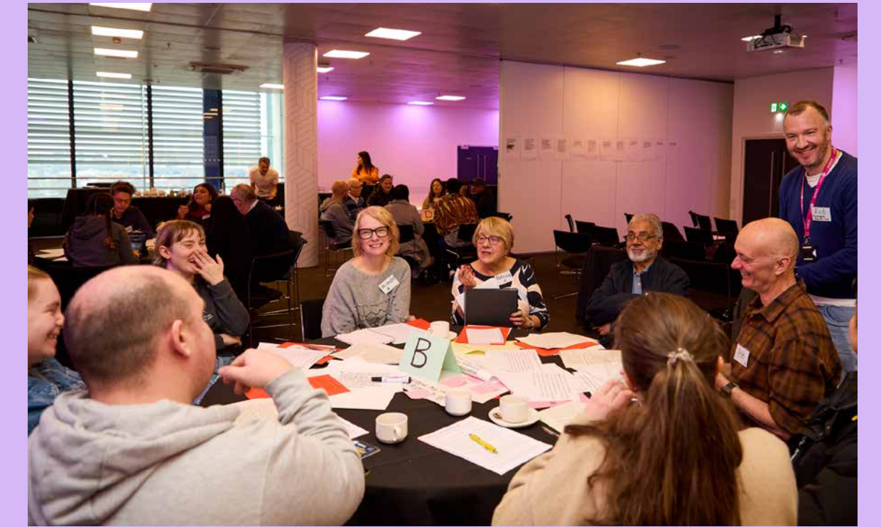
Rheithgor Dinasyddion Amgueddfeydd Birmingham

Roedd hyn yn rhan o gynllun hirdymor gan BMT i ymgysylltu â'u cymunedau a rhoi llais iddynt yn rôl a gweithredoedd BMT. Roeddent yn awyddus i annog y cyhoedd i gyfrannu at y broses benderfynu, ac i sicrhau bod y gwasanaeth amgueddfeydd yn cael effaith gadarnhaol ar Birmingham.